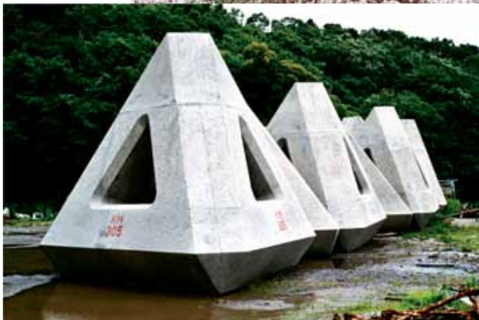
From top, clockwise: Les formes du Repos n°10 (Pipeline), 2006 Les formes du Repos n°9 (Half-Pipe), 2006 Les formes du Repos n°1 (Rhombi), 2005 Les formes du Repos n°8 (Tétraèdres), 2003