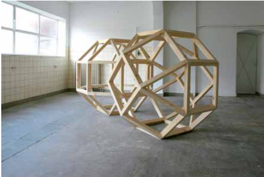
From left: Tautochrone (réplique n°3), 2007 Species of Spaces (film still), 2008 Rhombicuboctaèdres (Réplique n°1), 2007